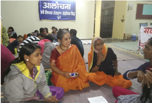
शिबिरातल्या रंगलेल्या गटचर्चा